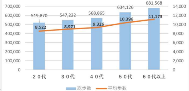
年代別総歩数・平均歩数

事業所の垣根を越えて複数の事業からなるチーム、奥様とチームを組んでともに頑張ったチームなど、様々なチームが結成されました。